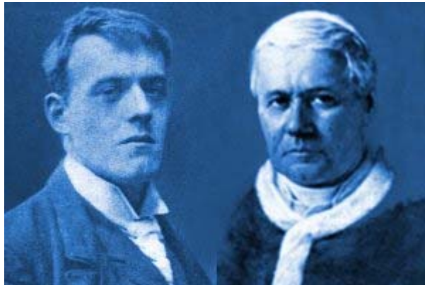
Hillaire Belloc y San Pío X

Cuando empezó a novelar tenía una idea tétrica de la Creación. En Alemania debe haber muchos; yo no conozco la literatura alemana.